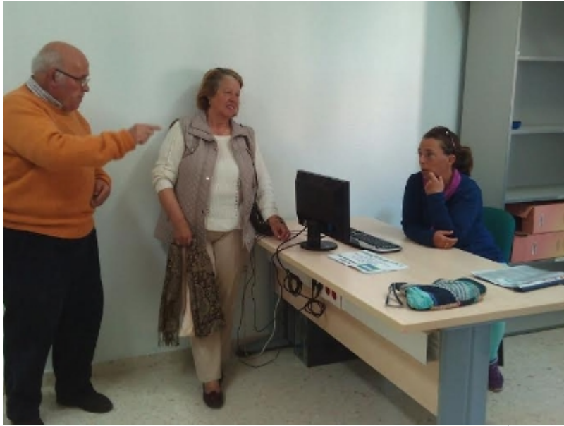
( http://www.sanbartolomedelatorre.es/es/.galleries/imagenes-noticias/Oficina-emigrantes-retoandos-3.jpeg )