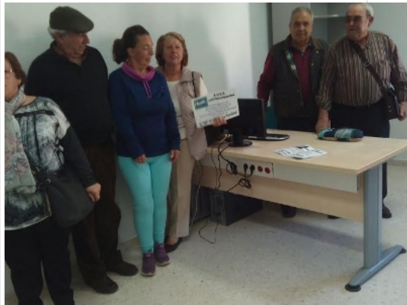
( http://www.sanbartolomedelatorre.es/es/.galleries/imagenes-noticias/Oficina-emigrantes-retoandos-4.jpeg )