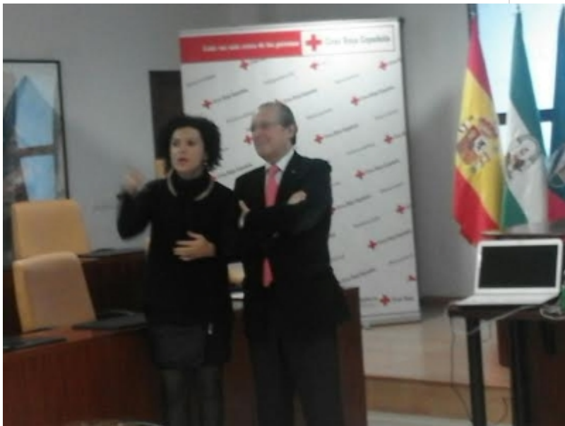
( http://www.sanbartolomedelatorre.es/es/.galleries/imagenes-noticias/Cruz-Roja-3.jpeg )