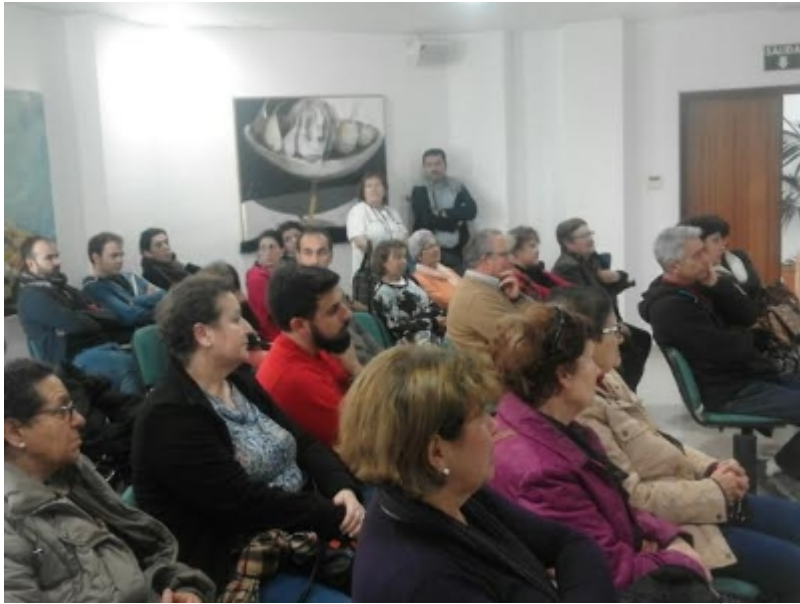
( http://www.sanbartolomedelatorre.es/es/.galleries/imagenes-noticias/Cruz-Roja-2.jpeg )