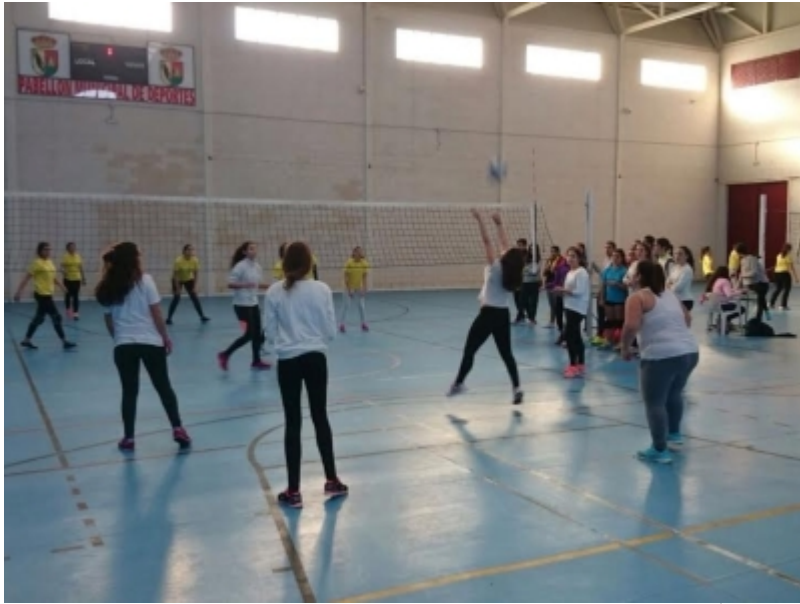
( http://www.sanbartolomedelatorre.es/es/.galleries/imagenes-noticias/Intercentro-2.jpeg )