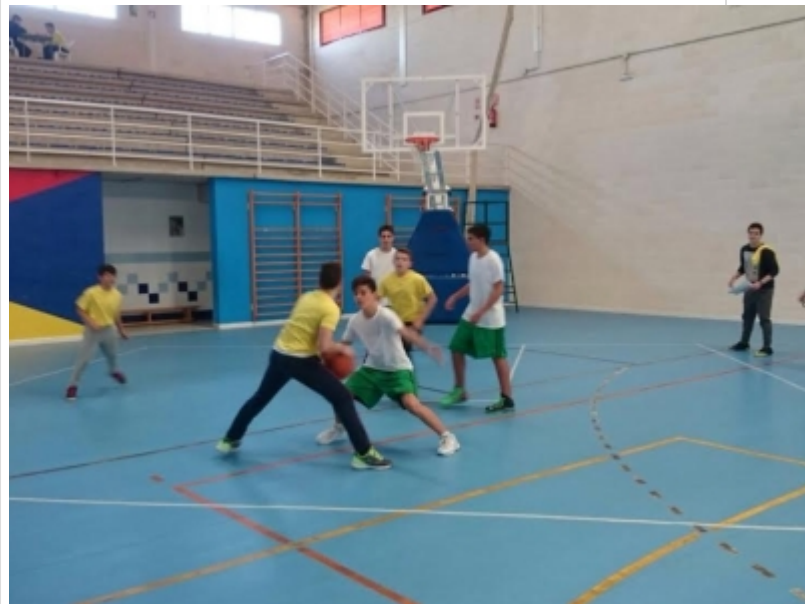
( http://www.sanbartolomedelatorre.es/es/.galleries/imagenes-noticias/Intercentro-3.jpeg )