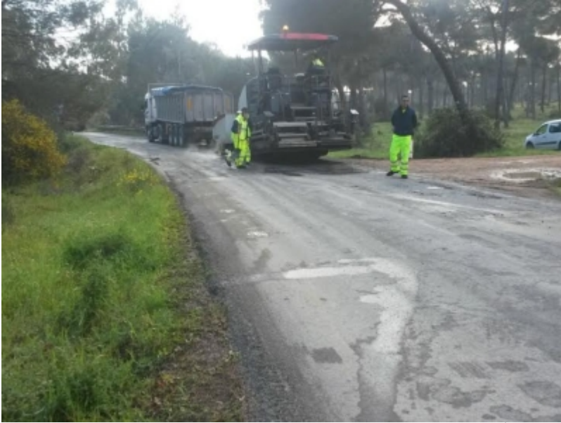
( http://www.sanbartolomedelatorre.es/es/.galleries/imagenes-noticias/Camino-de-las-Bodegas-2.jpeg )