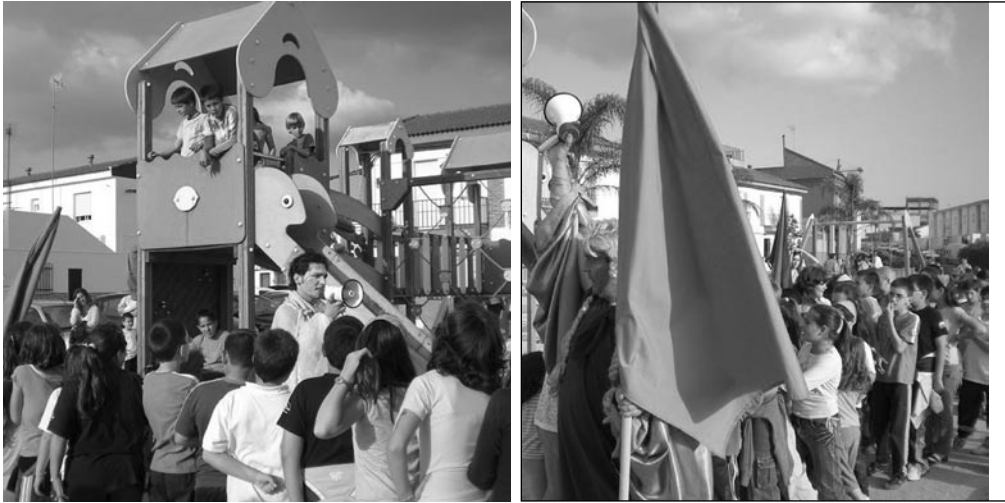
► Jardinería y pintura en las piscinas municipales.