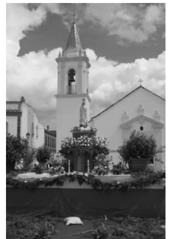
► Los altares levantados en las distintas calles embellecieron un año San Bartolomé.