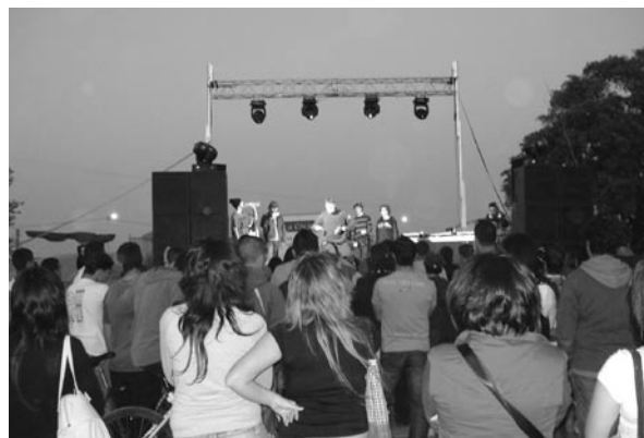
► Los jóvenes disfrutaron con la música y los talleres.

El éxito de participación por parte de los jóvenes de la localidad estuvo asegurado gracias a la labor de la corporación municipal de San Bartolomé por seguir trabajando en favor del ocio y disfrute de la juventud bartolina.