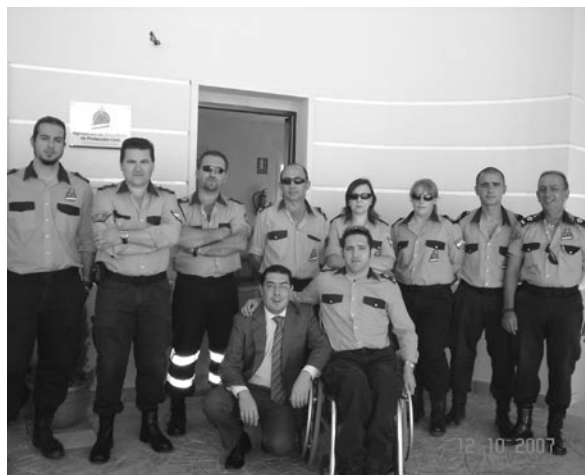
▲ Voluntarios de Protección Civil posan en la puerta de su sede, ubicada en un local cedido por el Ayuntamiento.

El alcalde, Manuel Domínguez, y el concejal de Seguridad y coordinador de Protección Civil, Domingo Jesús Martín, inauguraron oficialmente la sede de la Agrupación de Voluntarios de Protección Civil, el pasado 12 de octubre. La sede, abierta los viernes de 18 a 20 horas, está ubicada en un local cedido por el Ayuntamiento, en la Plaza Alcalde Lucas González Bonaño. Más de 20 voluntarios de varios municipios andevaleños forman esta agrupación abierta a cualquier persona que desee sumarse como voluntario. Sus misiones: prevención en actos públicos y apoyo a los cuerpos de seguridad.