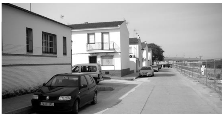
▲ Finalizada la colocación del nuevo colector en la calle del consultorio médico.