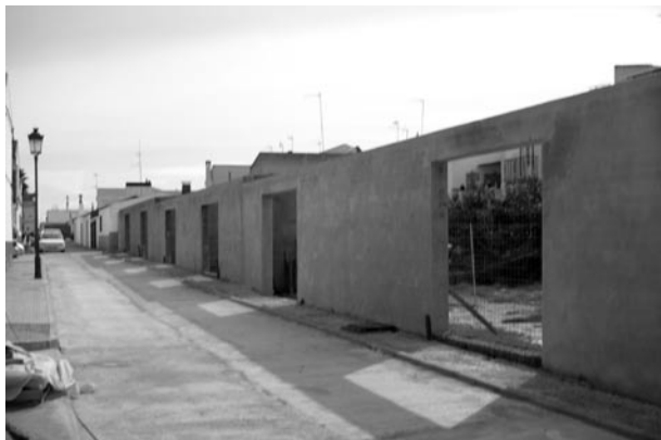
▲ Aspecto de las obras de la calle Zenobia.