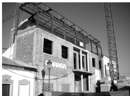
► Instalación de la cornisa del Teatro municipal.