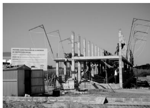
▲ Estructura de las ocho viviendas de Protección Oficial.