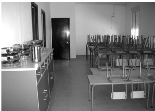
► Ampliación del aula matinal y comedor.