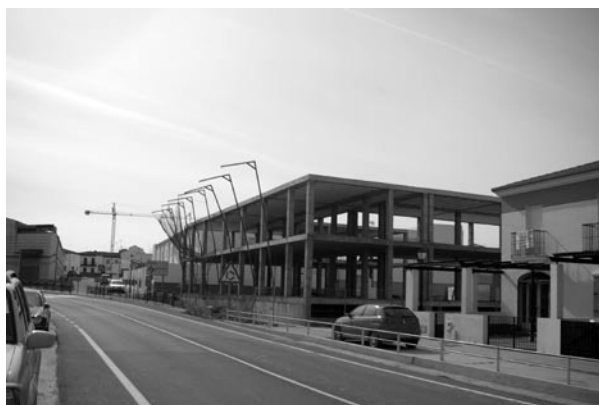
▲ Nueva planta para la reforma del proyecto de viviendas tuteladas.